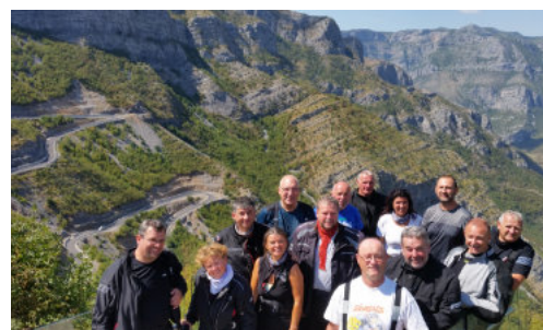
Tag 7: Shkodra (ALB) – Ohrid (MAK) 320 km

Wir erfreuen uns noch einmal der kurvigen Bergstraßen im Südosten Montenegros, bevor wir an die albanische Grenze kommen und das nächste Land der Tour besuchen. Der Zustand der Straßen, und ebenso die Freundlichkeit der Albaner, werden uns überraschen. Bei einem deutschsprachig geführten Stadtbummel erfahren wir viel über die Stadt und das uns so fremde Albanien. Übernachtung in Shkodra.