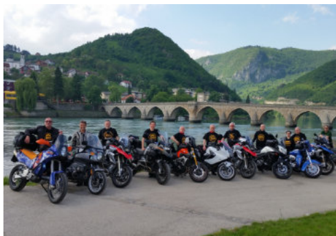
Tag 4: Mokra Gora (SRB) – Bosnien & Herzegowina – Zabljak (MNE) 215 km

Die Brücke von Visegrad, UNESCO Weltkulturerbe, ist der kulturelle Höhepunkt des Tages. Die Strecke dorthin entlang malerischer Schluchten ist eine mehr als würdige Vorbereitung bis wir schließlich die Grenze nach Serbien erreichen. Die kommunistische Vergangenheit ist an manchen Orten noch immer sicht- und spürbar. Der Mix mit der modernen Entwicklung macht den besonderen Flair Serbiens aus. Übernachtung in Mokra Gora.